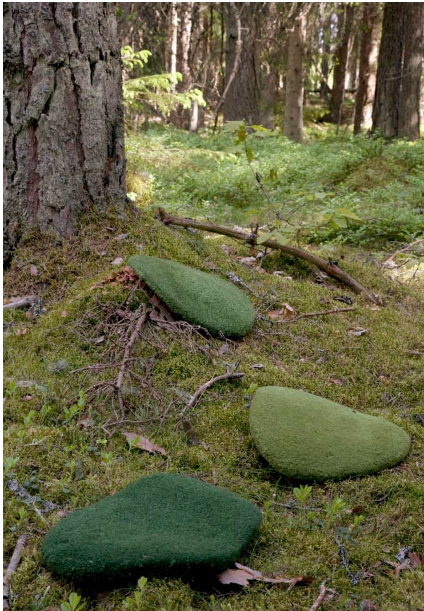
Ulrika's mostegels, geïnspireerd op het zachte mostapijt in het bos.