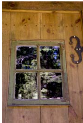
De hutten zijn opgebouwd uit hout en oude bouwmaterialen. Het beslag is speciaal gemaakt door een bevriende smid.