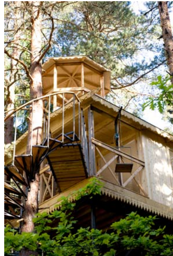
Håkans nieuwste project: een luchtkasteel met touwbrug tussen de boomtoppen.