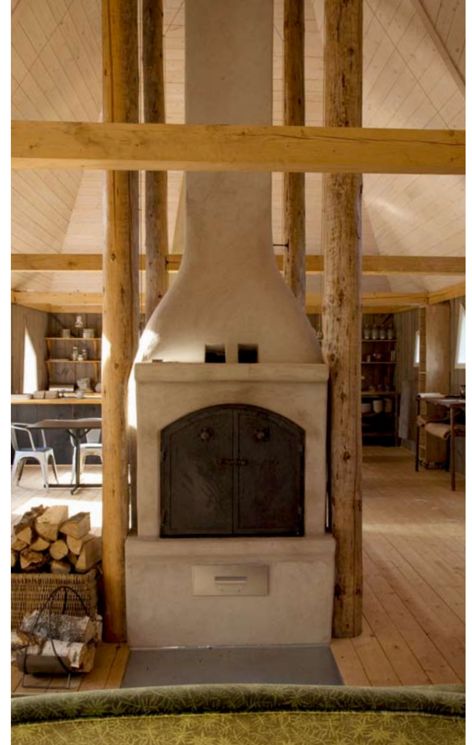
De oven in het Tinkasteel staat midden in de ruimte, de achterkant is een open houtkachel.